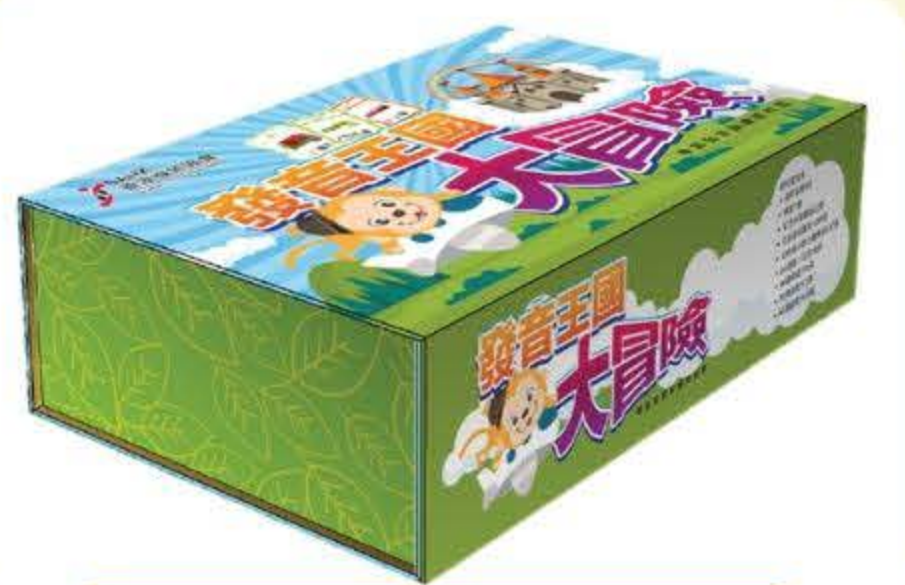
1.發音王國大冒險教材套